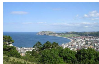
Grŵp Llandrillo Menai, Rhos-on-Sea and de kustlijn van Noord-Wales